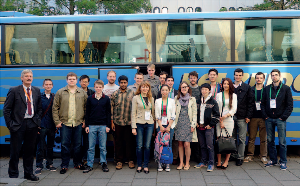
Travelling Fellowship -ryhmä lähdössä liikkeelle tutustumiskierrokselle. Kirjoittaja takarivissä neljäs vasemmalta