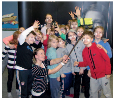
Kaisaniemen ala-asteen 4-luokkalaiset ryhmäselfiekuvaa ottamassa opettajansa johdolla Sinä teet suojatien -kampanjan vuoden 2015 aloitustilaisuudessa.

Liikenneturvan ylläpitämät kampanjasivut löytyvät osoit-