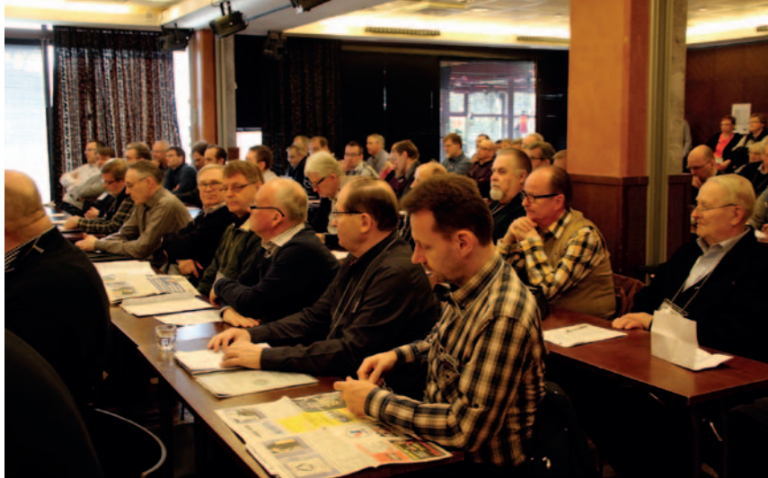
Kokousedustajat keskittyneenä kokouksen seuraamiseen.